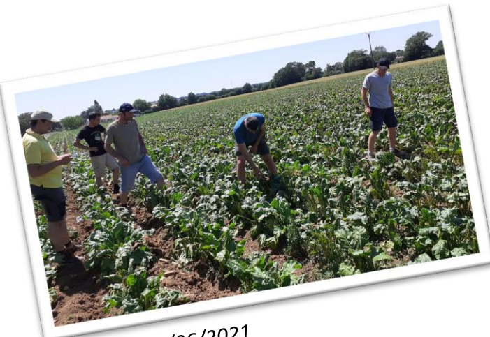
Photo du 14/06/2021