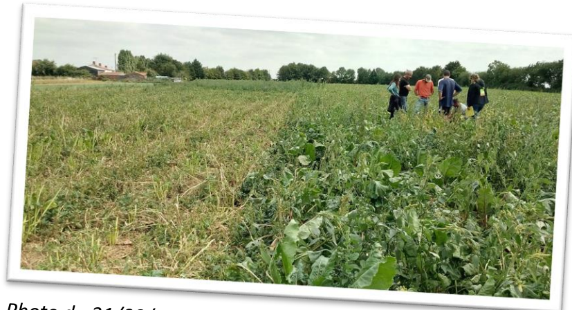
Photo du 31/08/2021 : à gauche semis juin broyé, à droite plantation juin